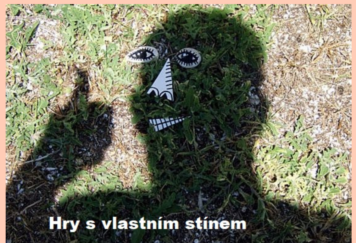
Hry s vlastním stínem